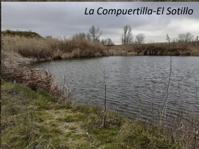
La Compuertilla-El Sotillo