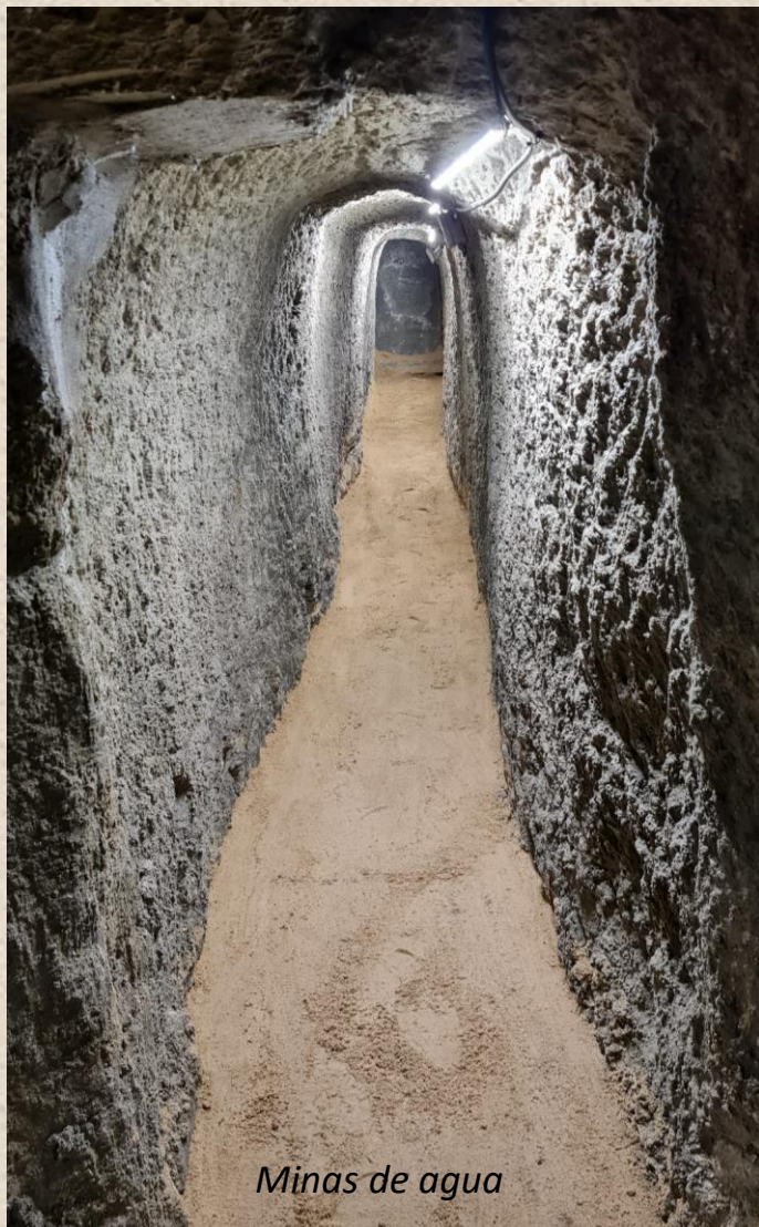
Minas de agua